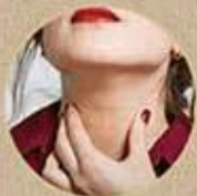
THƯỜNG XUYÊN CẢM THẤY VƯỚNG Ở CỔ HỌNG VÀ KHÓ NUỐT