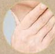
SUNG ĐAU VÙNG CỔ HỌNG