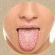
KHÔ RÁT Ở LƯỠI VÀ KHOANG MIỆNG, TIỂU TIỆN ÍT