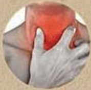
ĐAU HỌNG KÉO DÀI