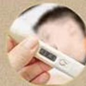
SỐT TRÊN 38 ĐỘ