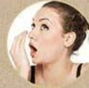
HÔI MIỆNG, HÔI THỞ LUÔN CÓ MÙI